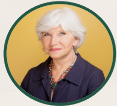
Laurence TUBIANA (en vidéo)

Directrice Exécutive de la Fondation européenne pour le climat (ECF)