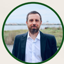
Samuel COHEN-SALMON Ambassadeur Pacte Européen pour le climat