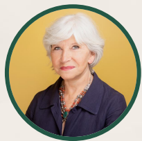
Laurence TUBIANA Directrice Exécutive de la Fondation européenne pour le climat (ECF)