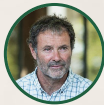
Christophe CASSOU Climatologue et Co-Auteur du 6 ème rapport du GIEC